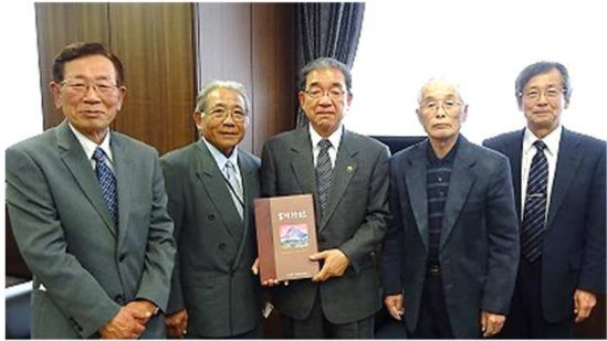
【3月14日、高垣新市長を表敬訪問】

連絡先: 吉川地域センター ☎082-429-1879 yoshikawa-k@city.higashihiroshima.hiroshima.jp