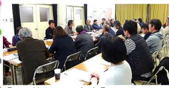
【上:第7回理事会】 【下:まちづくりカフェin八本松】

3月24日午後6時より、第7回理事会(拡大)を開催しました。理事会には、理事・監事・地区責任者・推進委員29名が参加。①平成30年度通常総会議案(骨子)②小学校統合問題への対応③吉川地区の自主