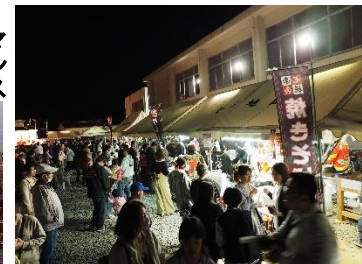
人波が絶えない屋台の周辺