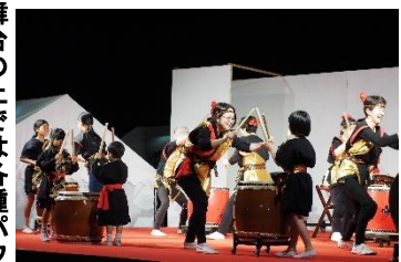
舞台の上では各種パフォーマンスで会場が盛り上がりました