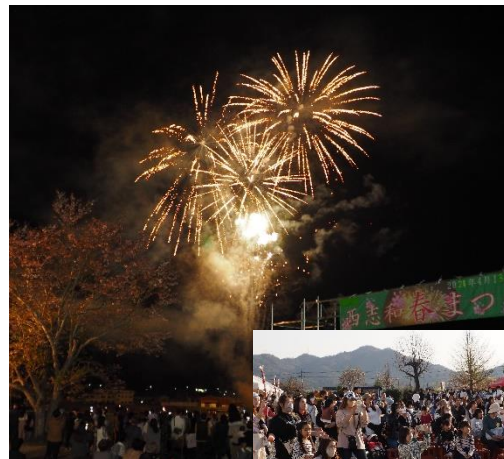
まつりの最後を締めくくり盛大に打ち上げられる花火