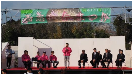
来賓をお迎えしての開会式 ↑

令和6年4月13日に、今年も西志和春まつりが開催されました。天気にも恵まれ多くの方（来場者約1,000人）でにぎわいました。