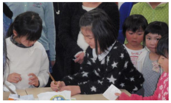
先生に勧められてデモンストレーションをしています