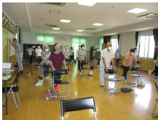
▲西志和元気クラブの百歳体操