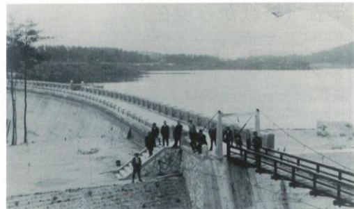
貯水池満水となる