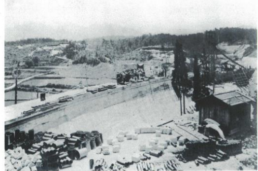
堰堤を西側から撮影 8割ほど完成 3本杉が残っている！ 2: