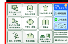
その他東広島市に関する情報が閲覧可能

東広島市が提供する「市民ポータルサイト」にお住いの地域を登録することで、住民自治協議会や自治会等から、その地域に関するお知らせを受け取ることができます。