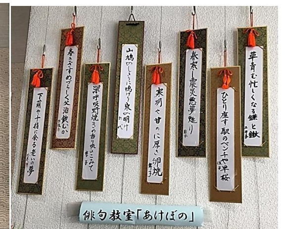
俳句教室「あけぼの」