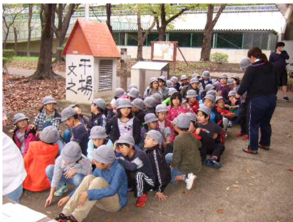
作業開始セレモニー 2014. 11. 06

クロージングセレモニーでの生徒代表の言葉です。「今日の作業は大変でしたがいい経験でした。楽しく出来ました。春先の綺麗な菜の花を楽しみにしています。有り難うございました。」