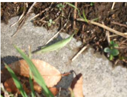
元気バッタ 2014. 12. 02

12月2日 見回り時には珍しくバッタを見つけました。この子も新芽をつまんでいたようです。この時点では他の幼虫による食害状況は見られませんでした。