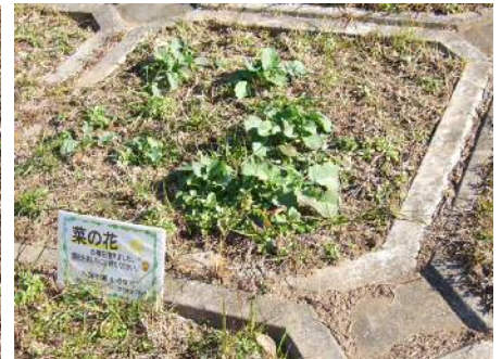
ひ弱な発芽 2014. 12. 02