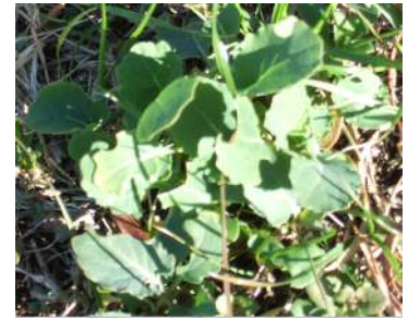
一部幼虫による食害を発見

今後も時機を見て肥料撒き作業と見守りが必要です、昨年も2月下旬の柔らかい日差しに多くの芽生えが見られ春先には見事に成育してきた菜の花が見られました。今年もその出来事に期待を育てていきたいと考えております。