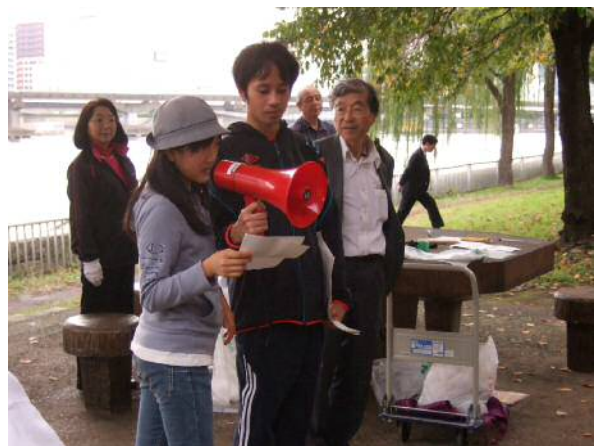
クロージングセレモニー 2014. 11. 06