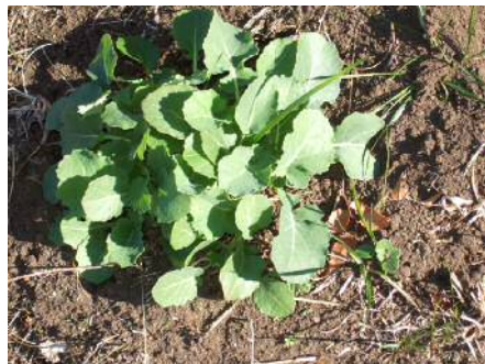
元気な発芽 2014. 12. 02