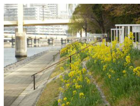
昨年の写真 2014. 03. 29