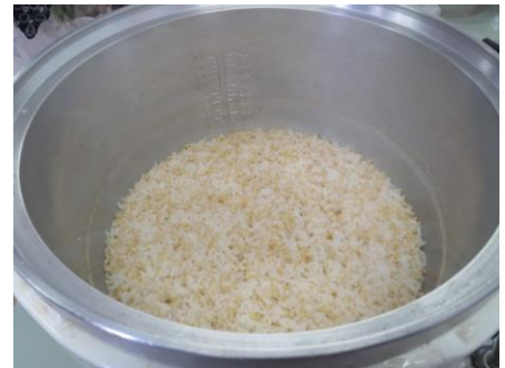
炊き立ての発芽玄米で、クコの実と松の実が乗ったおはぎを作りました。