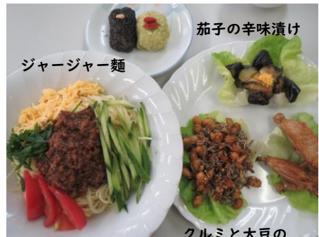
茄子の辛味漬け ジャージャー麺