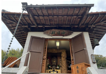
寿大学観音堂散策