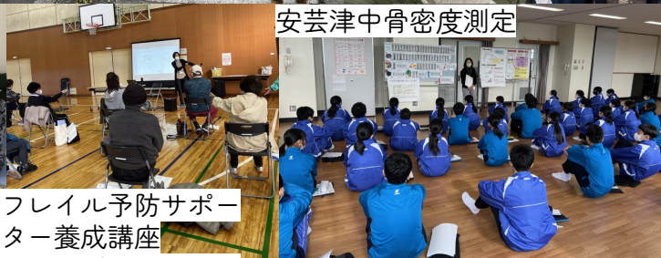
安芸津中骨密度測定