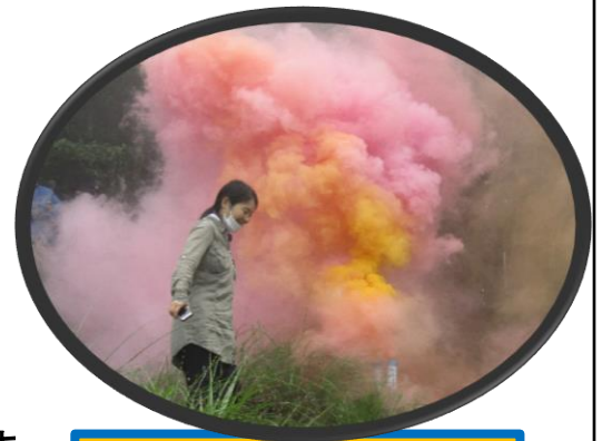
「のろしりレー」の風景