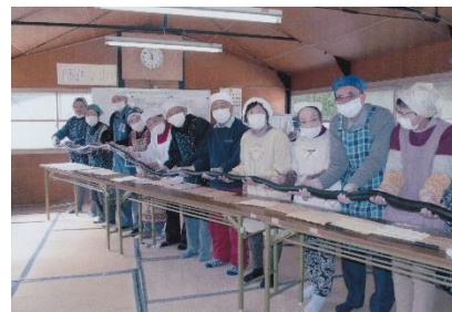
巻き寿司作りの写真です ▲

今年で18年を迎えました。活動は時季に合わせ、夏はソーメン流し秋は芋煮会が恒例になっています。寒い時期は室内の活動が多く、2月の節分の会では長い巻き寿司作りに挑戦しました。参加者の呼吸が合い約4mの巻き寿司ができました。サロン憩も高齢化で会員が減少しているので、今年は未加入者が参加してみたくなるような活動を行いたいと思っています。