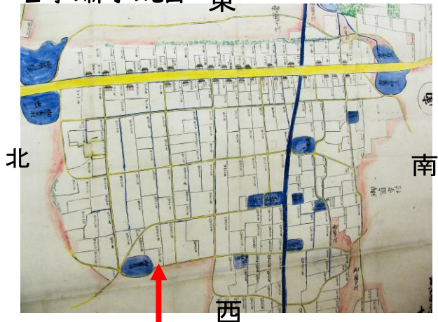
この辺りが現在の御菌宇地域センターです