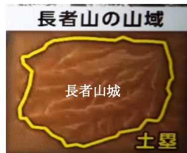
古市六町6反地籍図