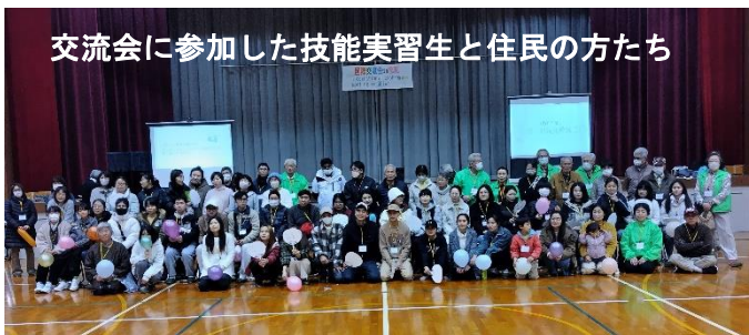
交流会に参加した技能実習生と住民の方たち

交流会を企画された「志和町支え合い会議」の方は、今後も交流会等を含めて助け合える環境を作りたいと話されていました。