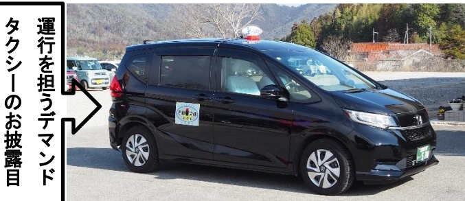
運行を担うデマンド タクシーのお披露目