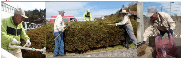
外の植木の剪定とスバメの巣の掃除してもらいました

また、センターをご利用して頂けるよう、よろしくお願いたします。センターでも魅力的な講座をご紹介しますように努めてまいります。