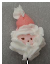
メレンゲで作った 作った サンタさん