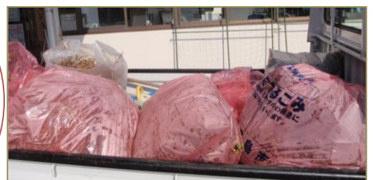
出た！出た！木々のゴミ、処分していただきありがとうございました