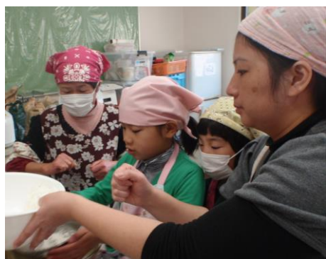
ロールケーキの指導中♪しっかりと泡立てすることが肝心です。(カタカタ)と！