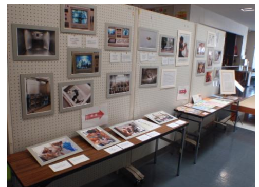
《小さな命の写真展》