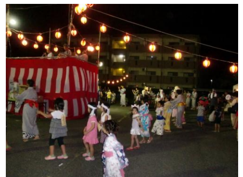
～子どもたちも頑張りました～ 《昨年の盆踊りの様子》