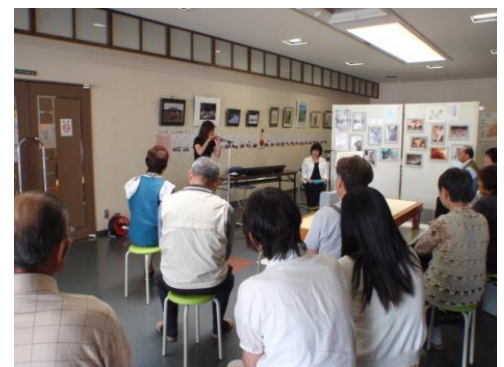
《多くの皆様が聴いてくださいました。》