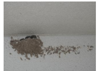
《頭をやっとのぞかせた 子ツバメ 5月18日》

子ツバメはさえずったり大きな口を開けたりしながらえさを待ち、親ツバメは短時間のうちにえさを渡しています。そのお蔭で、子ツバメは日に日に成長し、巣が小さく見えるようになりました。