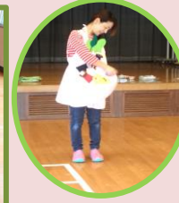
エプロンシアター