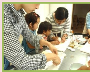
大好きなギョウザの皮で作ったパイ