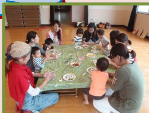
保育所の先生と小麦粉粘土でままごと遊び