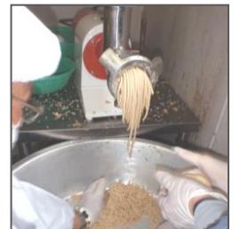
絞り出機で絞りだしています