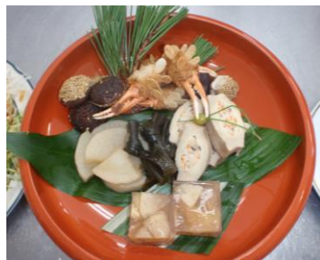
煮物と松かさ揚げとリンゴゼリー