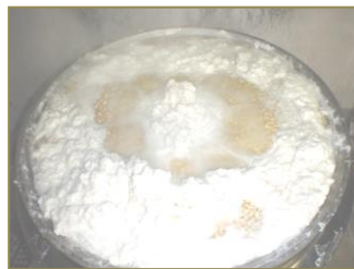
大豆を3時間かけて煮ています