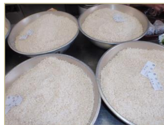
米麹・塩・用水を混ぜます