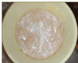
樽に詰め込んだ味噌