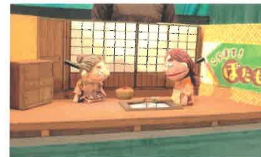
併演作品「こらまて！ほたもち」

【対象】 どなたでも（幼児は保護者同伴） 【入場開始】 13:30 【上演時間】 14:00～15:00 【定員】 50組程度 【会場】 高屋西地域センター ホール 【上演作品】 ききみみズキン（45分程度） こらまて！ほたもち（15分程度） 【事前申込要】 高屋西地域センターに置いてあるチラシの裏面の申込用紙をご記入の上窓口にお渡しください。 主催 高屋西小学校区住民自治協議会