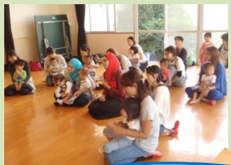
みのおしをつくった