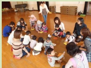
川上中部・東部保育所の先生とあそぼう