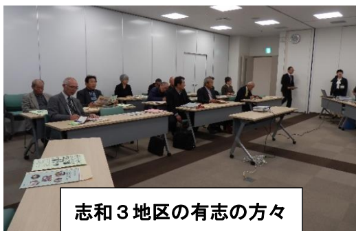
志和3地区の有志の方々

特に、同一志和中学校の生徒になる東志和小学校の児童を小中一貫校から分離した見切り発車は、どうでしょうか。西志和自治協はオール志和という考え方のもと、早期小中一貫校開校の方針で折衝しています。