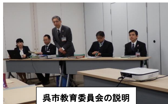
呉市教育委員会の説明