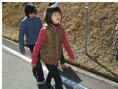
道端に春の花を見つけながら