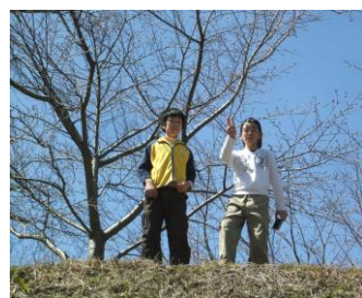
丘に登って「オーイ」