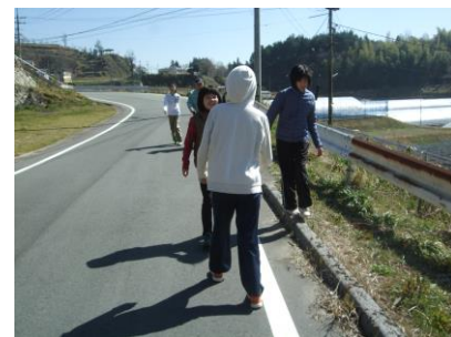
目的地はもうすぐ