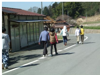
夕日庵に向かって