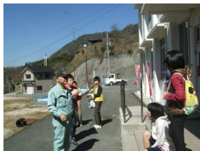
センターを10時に出発