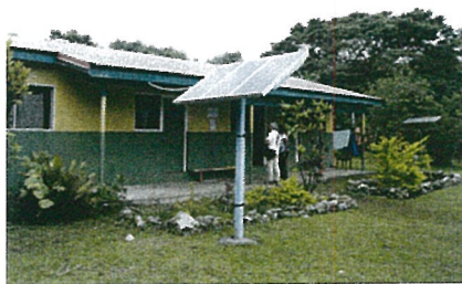
コールドチェーンの救世主を支援先各国へ

2012年、UNICEFと共に初めてワクチン接種についての接触を行った、タンナ島の村。約1年半後の2013年11月の視察時、伝統的な生活に変わりはありませんが、何人ものお母さんが子どもにワクチン接種を受けさせていました。