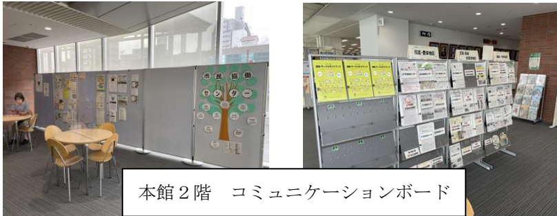
本館2階 コミュニケーションボード

団体登録をされていてご協力いただける団体は、下記のQRコードからお申込みいただけますよう、よろしくお願ひします。