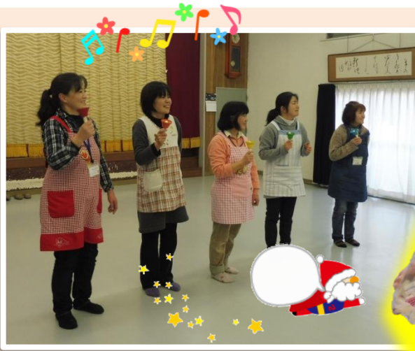
♪小谷地区母子保健推進委員の皆様♪