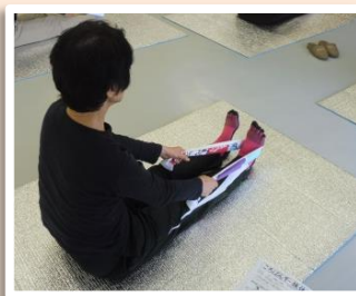
タオルのたぐり寄せ