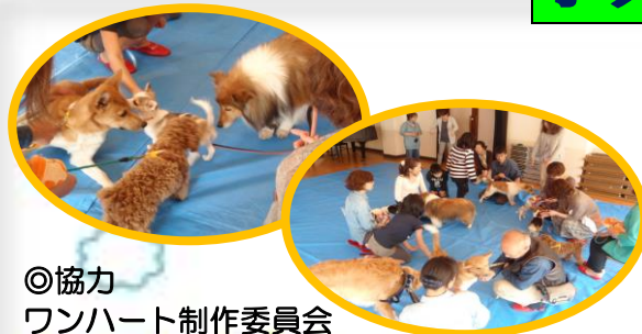
◎協力 ワンハート制作委員会