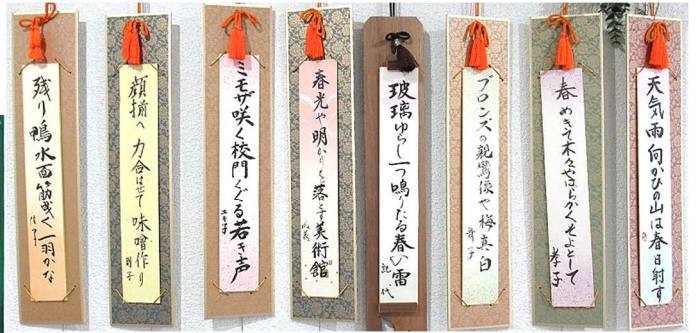
↑俳句教室の皆さんの作品