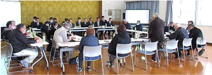
【市の説明を受けて意見交換】

吉川まちづくり自治協議会第2回全役員会議(第4回理事会)を3月10日開催しました。会議には理事会役員と地区責任者(自治会長・区長)20名が参加しました。