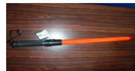
《寄贈していただいた誘導棒》