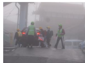
《土与丸歩道橋付近》

子ども達の安全を思い、励んでおられる安全ボランティアの皆様方に感謝申し上げます。