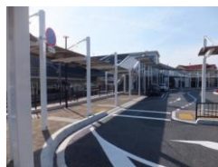
《JR 西条駅北口の様子》