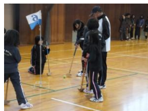
《体育館でのグランドゴルフ》

東西条小学校の先生方、体育振興会の皆様、そして、参加して下さったすべての皆様にお礼申し上げます。これからも健康に気をつけて毎日の生活を送っていきたいものです。