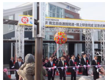
《西条駅舎落成式・南北通路開通式》

また、安芸国分寺歴史公園の全面開園にあわせて、3月26日に開園式が行われます。これらの施設を有効に活用し、地域の発展に少しでも貢献できたら良いと思います。