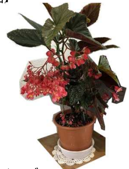
△ペゴニア 地域の方から提供された花をロビーに展示しています。