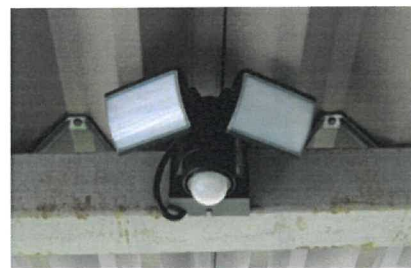
【センサーライト (移動階段)】