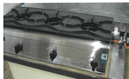
【ガスコンロ (調理室)】

昨年度の修繕費を活用させて頂き、調理室の「ガスコンロ」2台を入換え、大ホール(体育館)の誘導灯と研修室から大ホールへの移動階段へ「センサーライト」3台を取り付けました。