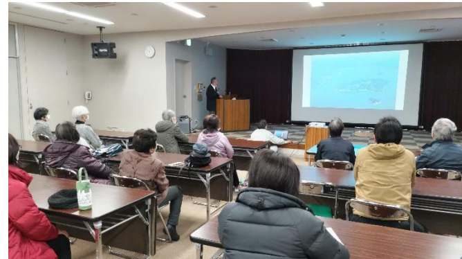
安芸津支所にて熱心に講話を聴く参加者の様子

今回の「大人の社会見学」は、19年前に合併した海のある町、安芸津町を訪れました。