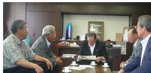
【蔵田市長に面談(5月24日市長執務室にて)】

れば、申込み終了。利用者本登録が終わり情報がメールで届きます。一方、情報を発信する場合は、事務局に電話連絡し、指示に従って内容を伝えると、事務局から情報を利用者の携帯電話・パソコンに届きます。なお、利用者の加入料金及び利用料金は不要ですが、使用する携帯電話の通信会社との契約によっては、着信料金が発生する場合があります。7月までは、試験運用で課題を抽出し、対応した後、8月1日正規運用を開始します。