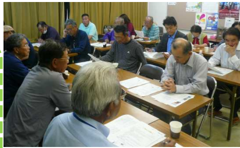
【役員会の模様(5月20日/地域センター)】

吉川村づくり推進委員会(住民自治協)は、5月21日午後6時30分から1時間、臨時役員会を開催し、①地域情報連絡として「電子メール」方式(吉川メールと呼称)を、今年8月を目標に導入すること、②広島大学生サークルが5月29日に西条中央公園で開催する「東広島マーケット」とむすびの場への参加に関連し、吉川小学校が小規模特認校であることを市民の皆さんに周知する活動に取り組