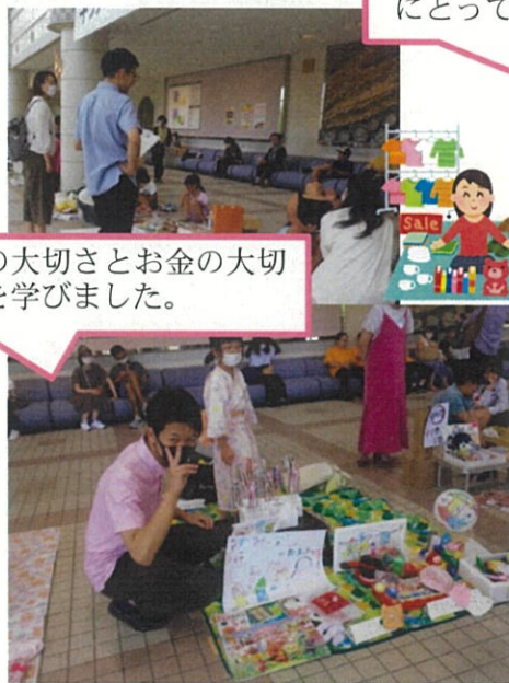
物の大切さとお金の大切さを学びました。