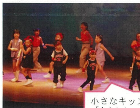
小さなキッズのダンスが「かわいい」！