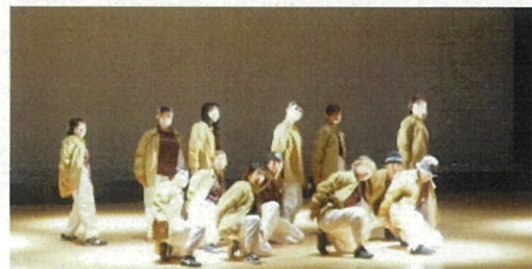
今年はチアダンスとバトンチームも参加！