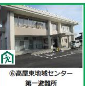
⑥高屋東地域センター 第一避難所