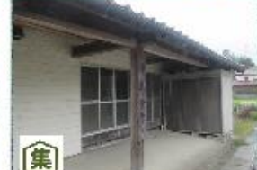
⑱沖集会所：地盤が低く川や道路表流水の影響が懸念