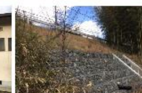
㉛県道の崩落・対策後