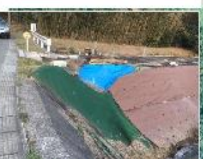
㉓道路のり面の崩れ