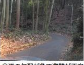
⑭道の勾配が急で避難が不安