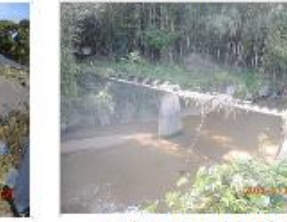
㊳橋の上面土砂流出