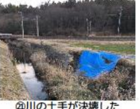
㉞川の土手が決壊した