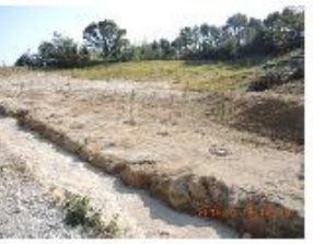
⑮太陽光発電 排水設備なし