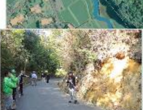
㉑道路斜面が崩壊している