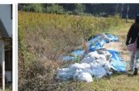
㉝川の水が上昇して田に流出した