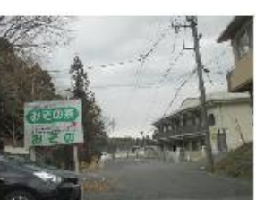
⑭みその寮 老人福祉施設