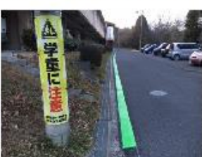
⑬歩道狭く歩行者注意