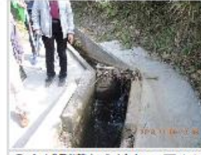
㉟水が側溝から流れて田んぼに流出