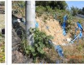
㊲道路のり面土砂崩れ