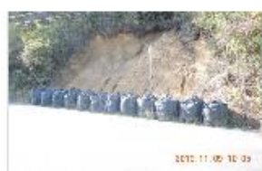
⑰斜面崩壊 2車線道路ほぼ塞ぐ