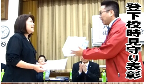
登下校時見守り表彰