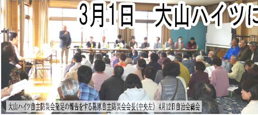
大山ハイツ自主防災会発足の報告をする葛原自主防災会会長(中央左) 4月12日自治会総会