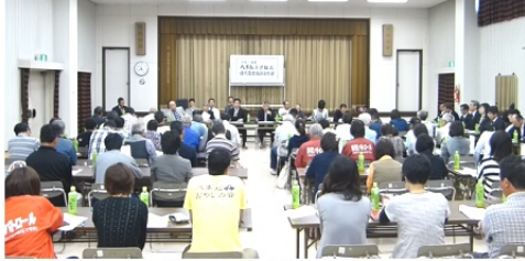
自治協総会で審議する役員と評議員 (H27.05.17)

を目指した「ウォーキングコース等環境整備」を重点活動とする他、市民スポーツ大会3連覇等各部会の活動もステップアップした取り組みをすることとなった。