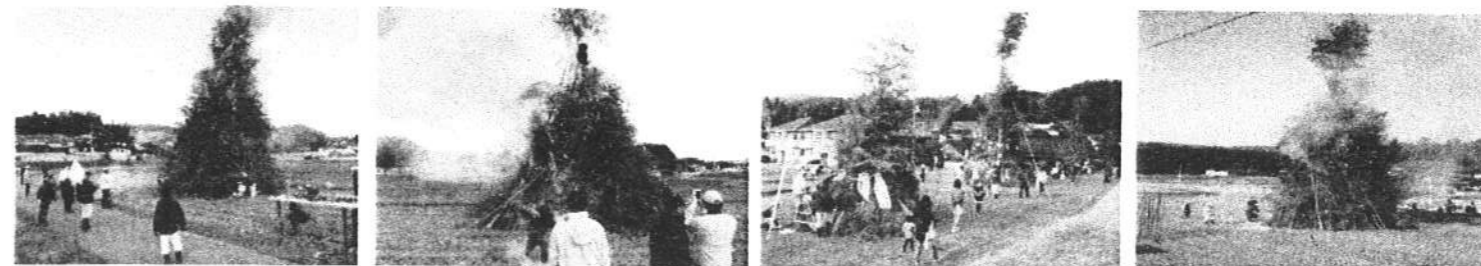
創意工夫をされて新しい年の門出と友情友愛と絆のために酒を酌み交わす、こども達は歓声で大はしゃぎ

どんど焼とは 日本各地で行われる小正月(1月15日)の火祭りです。とんどさん、とんど焼、さんくろうなどともいいます。お正月に使った門松やしめ縄、お守り、破魔矢、祈願成就した「だるま」などを持ち寄って焼き、その火にあたり、餅を焼いて食べて無病息災を願うものです。お正月にお迎えした神様をお送りする日本の伝統的な行事です。各自治会も大勢の参加でした。とんどの風景です