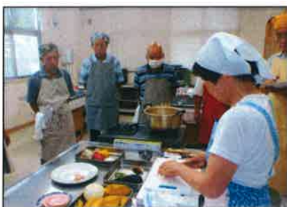
先生の説明を熱心に聞いてます

皆さんの感想から かぼちゃのスープが絶品だった。 家族や孫に作ってあげたい。なすび の料理も味噌・醤油・辛子のソース が美味しく刺激的だった。 安値のモモ肉も工夫で柔らかくて 美味しい料理になった!感動! 次回12月2日、クリスマス料理に 挑戦です。ふるってご参加下さい。