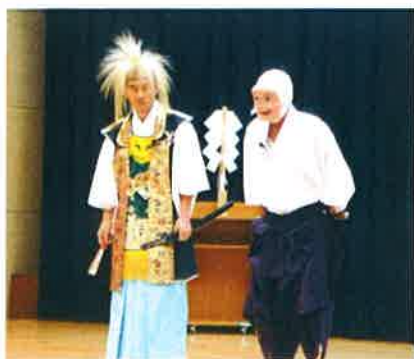
大蛇と小田神楽団の人達