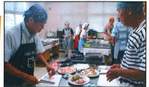
鶏のモモ肉を薄切りにしてたたいています やわらかい肉になりますよ