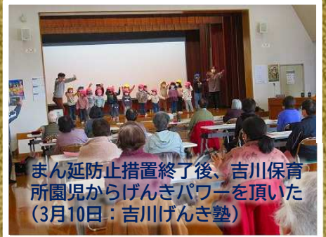
まん延防止措置終了後、吉川保育 所園児からげんきパワーを頂いた (3月10日：吉川げんき塾)