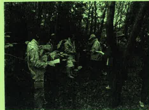
【茶臼山城跡の現地調査風景】

★現在、地権者の同意を得て、シルバーさんにより通路の確保や主郭・副郭を覆った木々を伐採していただいております、 《2月9日(土)》には賀茂北高校の1学年の生徒全員によるボランティア活動の一環としての整備作業を予定しています。 当日は「高校生の地域おこしへの協力」と題して、中国新聞やNHKテレビの取材も入ることになっています。