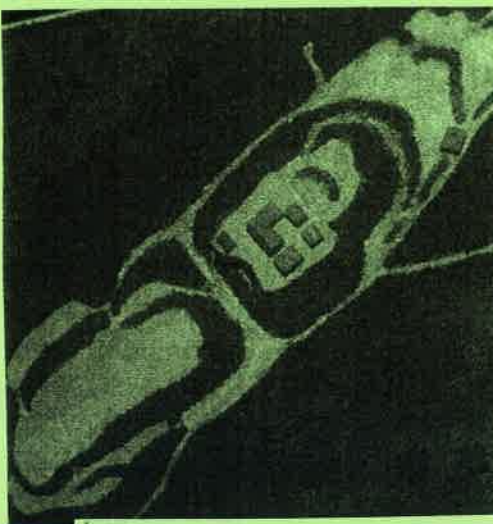
【茶臼山城跡の復元ジオラマ(柏原英治氏作)】