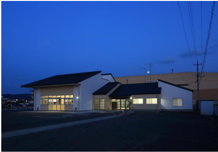
照明はすべてLEDになりました！