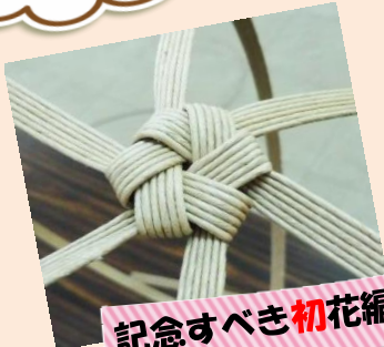
記念すべき初花編み