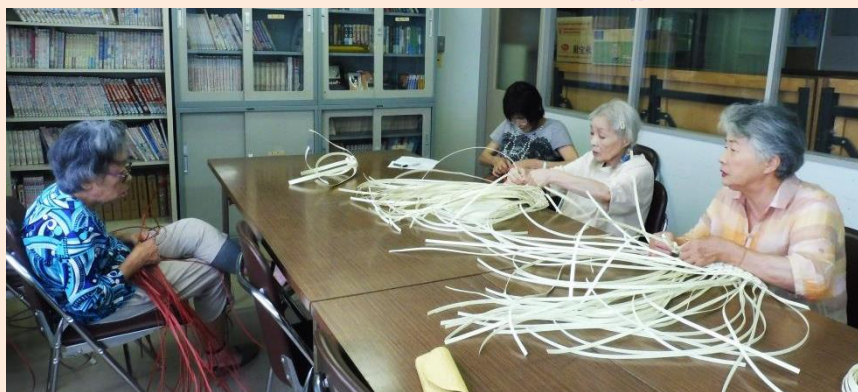
基本編みをマスターすると、あとはしめたもの。 みなさん次回に向けファイトです !(*^_^*)!