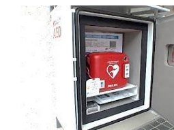
(黒い留め金を手前に引くと扉が開きます。)