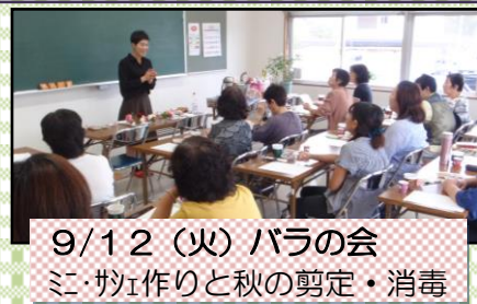
9/12(火) バラの会 ミニ工作作りと秋の剪定・消毒