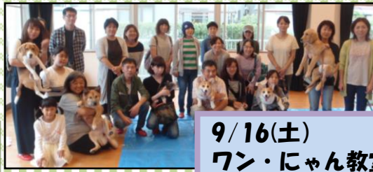
9/16(土) ワン・にゃん教室