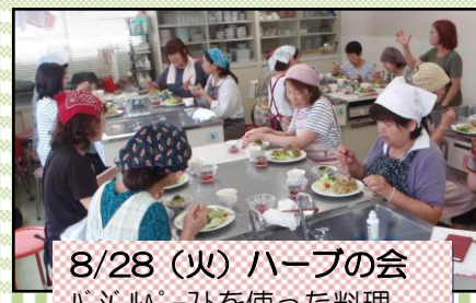
8/28(火) ハーブの会 バジルペーストを使った料理