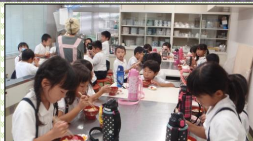
9/7(木) 放課後子供教室(1年)