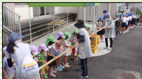
9/14(木) 放課後子供教室(2年)