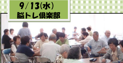
しりとりにゲーム遊び