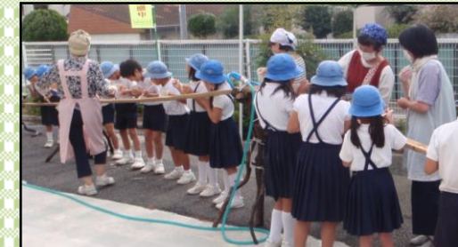
9/21(木) 放課後子供教室(3年)