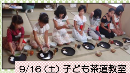
9/16(土) 子ども茶道教室