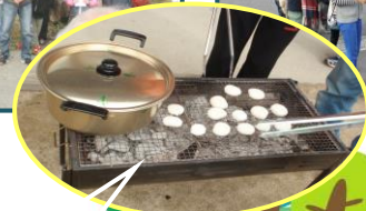
ぜんざいの手作り餅