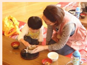
初めてのお抹茶の味はどう?