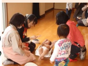
身体計測、大きくなったかな