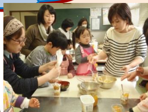
子供たちの大好きなパフェづくり