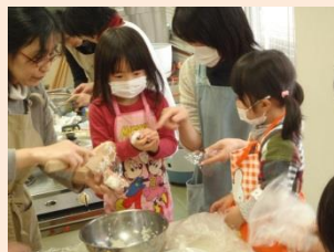
お雑司寿司を作っています