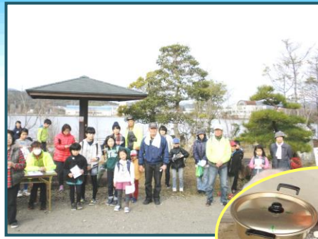
大沢田公園の登山出発前風景

下山後は、ぜんざいと空くじなしの抽選会。フライパンを当てたお父さんやビールを当てた小さな子供のちょっと残念そうな顔が、笑いを誘う楽しいひと時となりました。