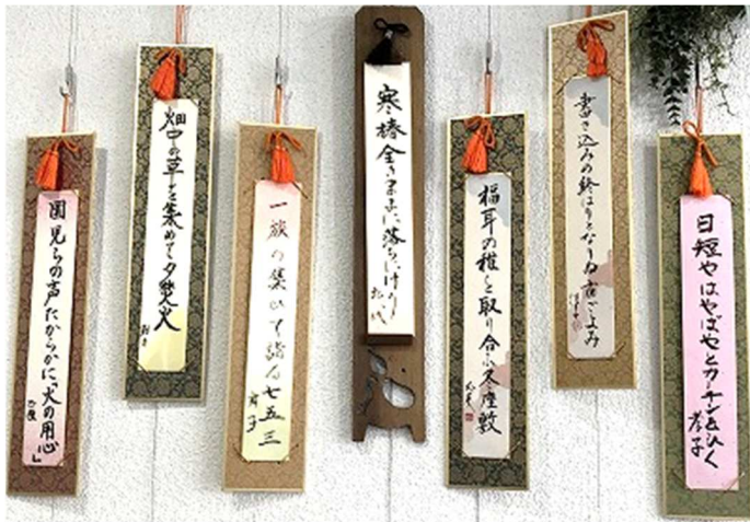
俳句教室「あけぼの」生徒さんの作品