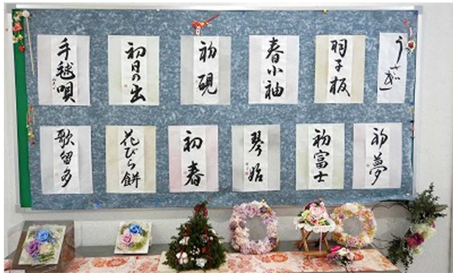
上段：「書にしたしむ会」 下段：フラワーアレンジメント教室 各生徒さんの作品