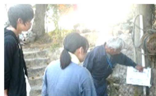
広大生に炭焼きを説明