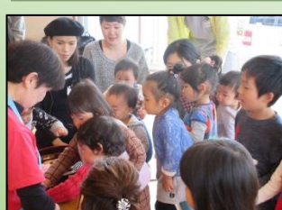
バప్పんじゃけんさん