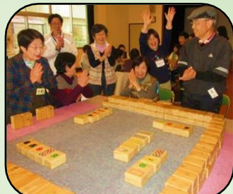
社協さんの麻雀ゲーム