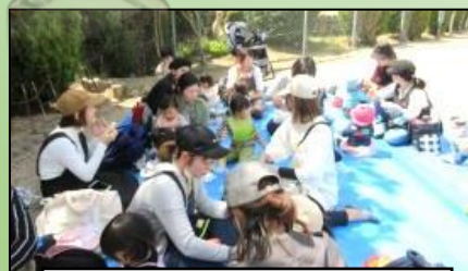
ぐるぐるジャムサンドを作って広場でピクニック♪