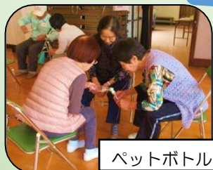
ペットボトルでビー玉運び