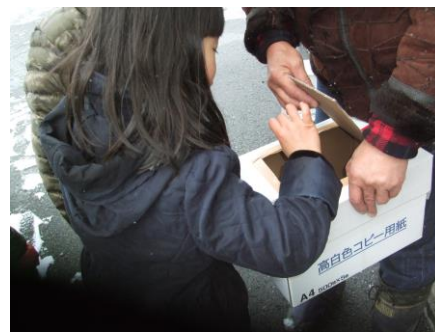
センターにてくじ引きを

嶽が城（別名 城山、障子が岳）は、南側は急峻で、遺構として本丸跡50m×15mほどの広さ。周囲に石積みの土塁や空堀、数段の郭が残っている。地域の有志の手によって登山道の整備や頂上の美化につとめられている。春には、頂上にさくらやつつじの花が咲きます。また東屋があり休憩できます。是非、嶽が城にお越しく下さい、眺めもすばらしい所です。