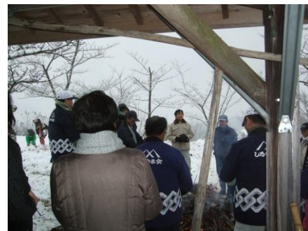
四季の里会長あいさつ