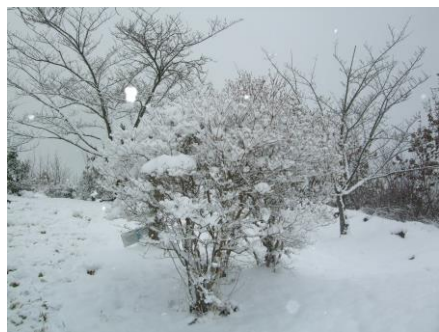
頂上の桜、つつじの木に雪が