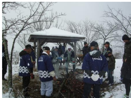
しろやま会のみなさん