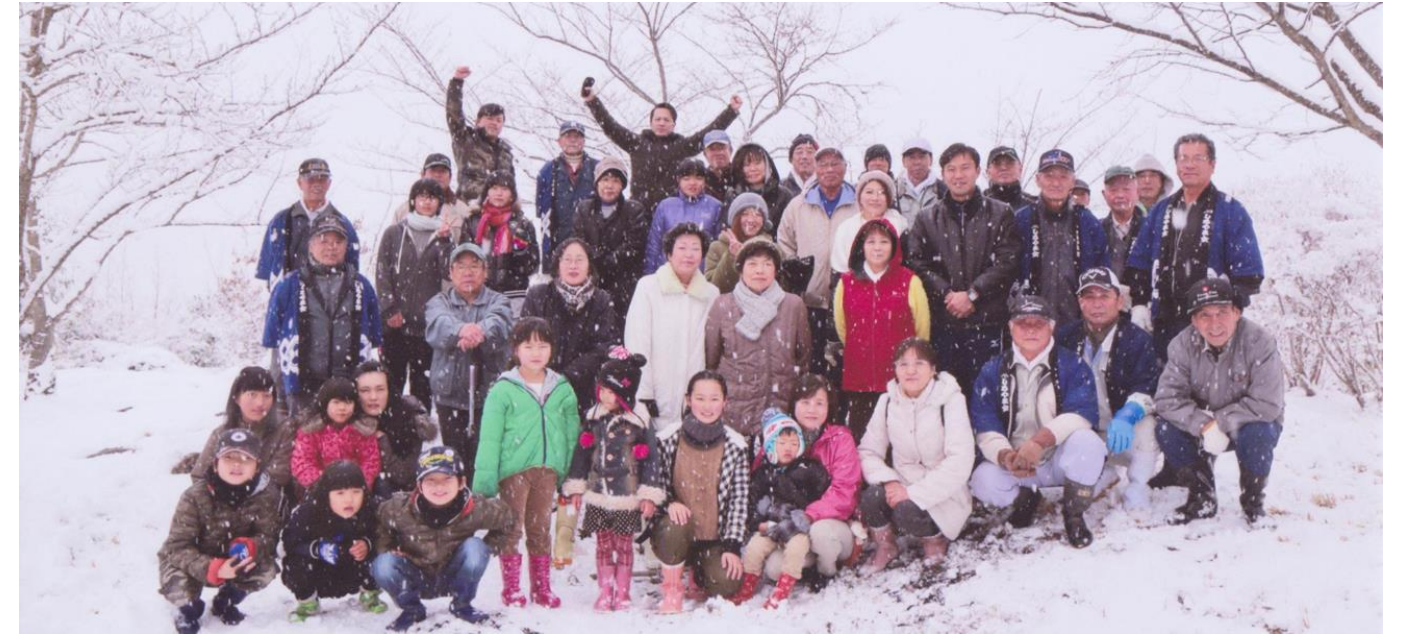
新春登山記念写真

記念写真も雪の降る様子が写っています。360度の頂上も景色は何一つ見えず白一色でした。