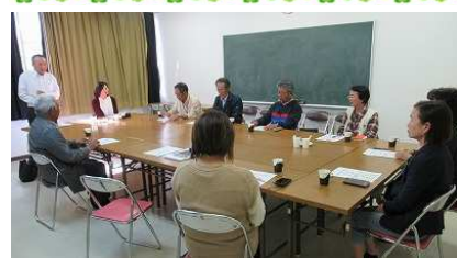
【地域の実状を踏まえて、地域が必要とする高齢者支援を話し合う】

10月22日午前中に、市内高屋地区から民生児童委員6名と市社会福祉協議会から2名の方が自治協を訪問され、地域にお