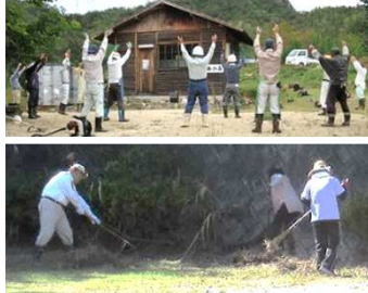
【吉川都市公園清掃-公園里親】

吉川長寿会は、10月12日、午前8時から榎山城址のふもと長寿の森の草刈り活動を行いました。作業には、会員を中心に20名が集まり、広場周辺と豊穰池の周りの草刈りを行いました。