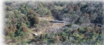
ドローンによる土石流の溪流調査：助実地区