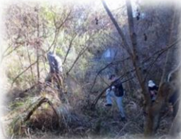
徒歩による土石流溪流調査：助実地区