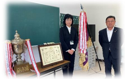
優勝旗と優勝トロフィー