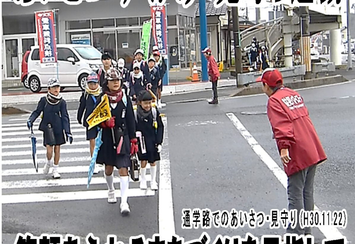
通学路でのあいさつ・見守り (H30.11.22)