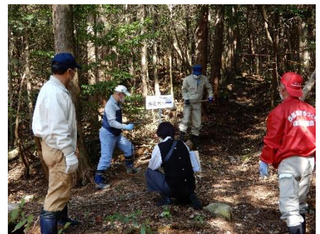
（中国新聞記者の取材風景）